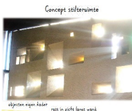
Concept stilte ruimte objecten eigen kader rust in zicht lange wand